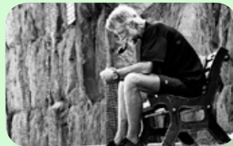
mas sch io