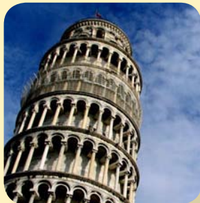
Torre di Pisa