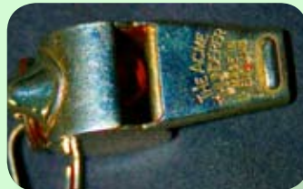
fis ch ietto